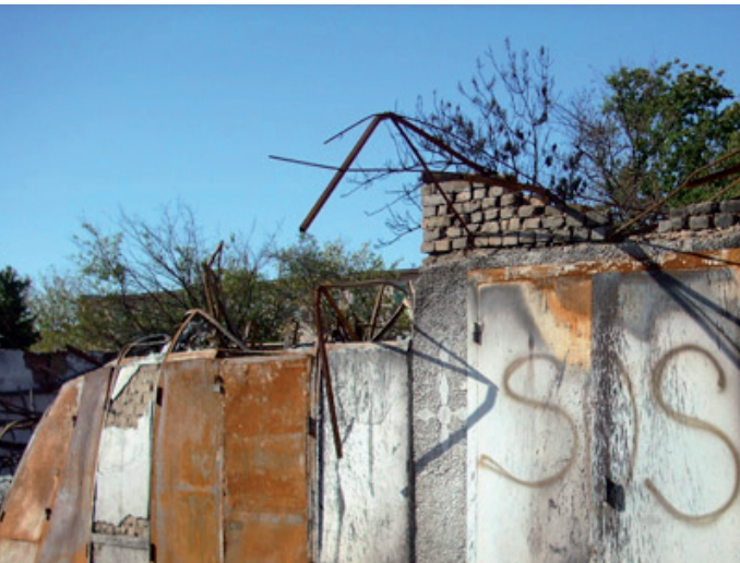
Bild 6. Ett av många SOS-meddelanden som skrevs på väggarna i Osj under de etniskt färgade upplöpan i juni 2010.

veckling i Centralasien, Central Asia Energy-Water Development-Program (CAEWDP). Programmet ska i ett första skede pågå under 4 år och syftet är att studera områdets vatten- och energipotential, samt att medla och bidra till uppbyggnaden av hållbara samarbeten mellan länderna. CAEWDP innefattar en mängd internationella organisationer, såsom Asian Development Bank (ADB), Islamic Development Bank (IsDB), Eurasian Development Bank (EDB), Aga Khan Foundation, samt FN-organen UNDP och UNECE, EU-kommissionen och biståndsorgan från Tyskland, Schweiz, Storbritannien och USA.