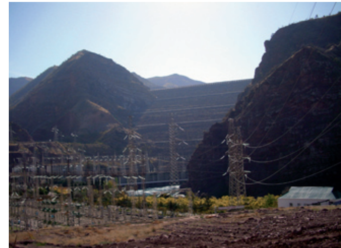
Bild 4. Nurek-dammen i Tadzjikistan.

Uzbekistan har protesterat högljutt mot detta projekt som man är rädd ska minska tillgången på vatten till de odlingsmarker som bevattnas från Amu-darya. Man har även vidtagit konkreta åtgärder, bl. a. genom att 2009 dra sig ur den gemensamma energiinfrastruktur som byggdes upp mellan de Centralasiatiska republikerna under sovjettiden. Det har lett till att både Tadzjikistan och Kirgizistan lider akut brist på elenergi och gas under de kalla vintermåna-