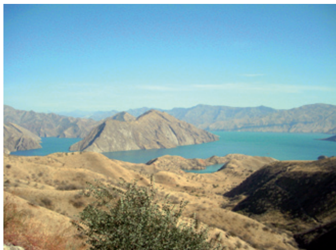
Bild 1. Den artificiella sjön ovanför Nurek-dammen i Tadzjikistan.

Efter Sovjetunionens kollaps 1991, när dessa republiker blev självständiga stater, blev det av förståeliga skäl betydligt svårare att upprätthålla samordningen. Detta fick nästan omedelbart kännbara konsekvenser på vatten- och energiområdet. Genom Centralasien rinner flera gränsöverskridande floder som används både för hushållsbehov, bevattning och energiproduktion. Dessa användningsområden kommer ibland i konflikt med varandra, och eftersom Centralasien är ett område med ganska dramatiska kontraster i landskapet är förutsättning